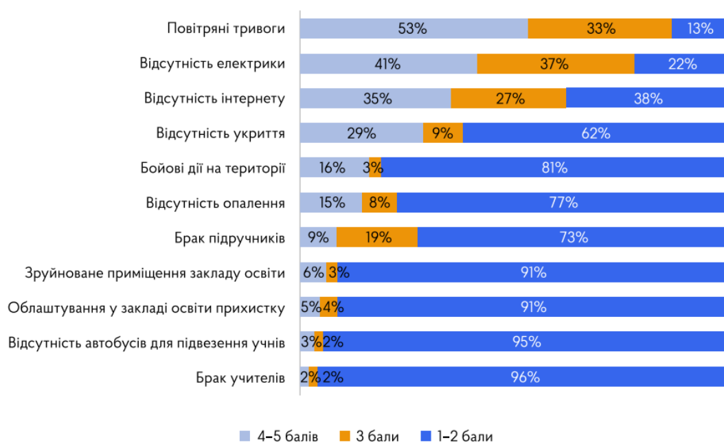
Рис. 2. Основні проблеми в організації освітнього процесу у територіальних громадах України під час війни