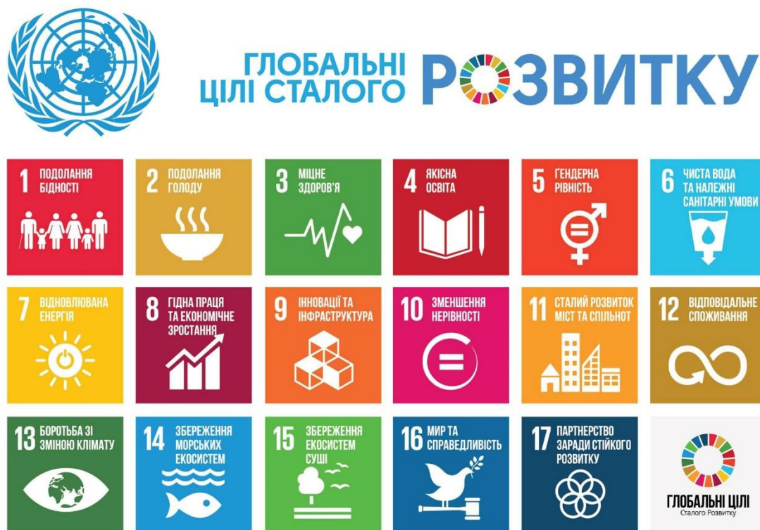
Рис. 1 Цілі сталого розвитку

Цілі сталого розвитку (Sustainable Development Goals, SDGs) - це універсальний набір цілей та завдань, що були прийняті всіма членами Організації Об'єднаних Націй у вересні 2015 року. Ці SDGs становлять план дій на період до 2030 року для забезпечення сталого розвитку людства на планеті.