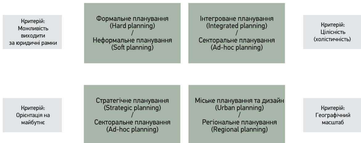
Рис. 1. Різновиди просторового планування

Різновиди просторового планування наведені на рис. 1.